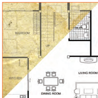
Verbessern Sie Ihre Originale